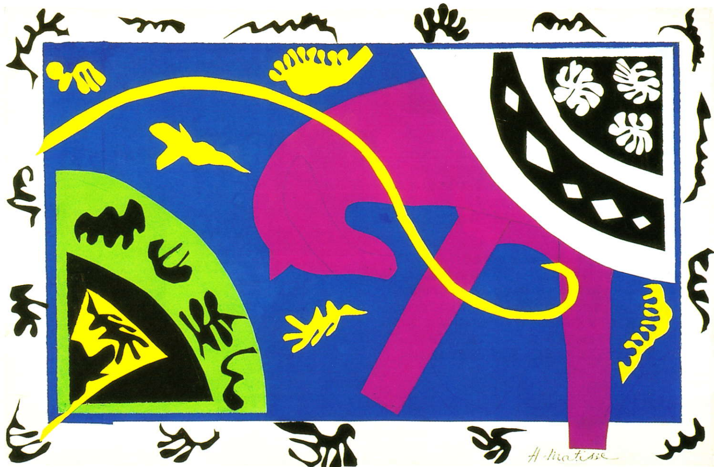
アンリ マティス「馬、曲芸師、道化師」1943 ©2005 Succession H. Matisse, Paris/SPDA, Tokyo