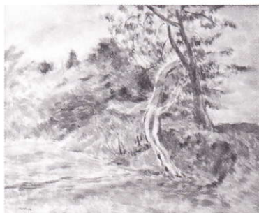
奈良新緑 油彩 山下新太郎