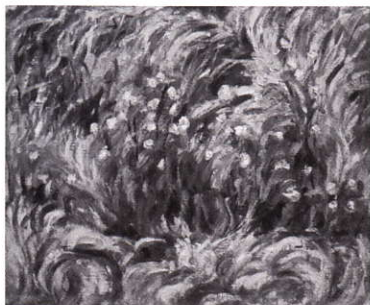
茂みの中の花 油彩 西村伊作