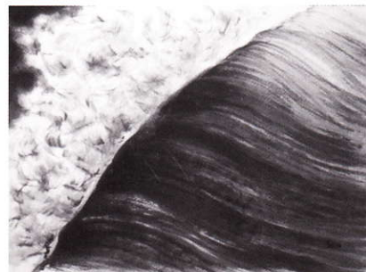
サンタクールの波 水彩 ソノ西村ベガード

入場料 大人：800円 大学・高校生：600円 中学・小学生：400円 (団体割引、身障者割引あり)