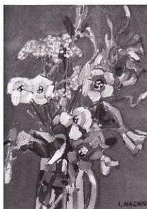
花 油彩 磯伊之助