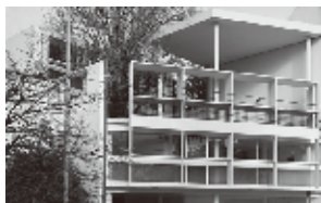
クルチェット邸 (アルゼンチン)