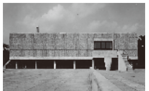
国立西洋美術館 (日本)