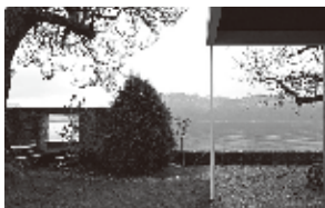
レマン湖畔の母の家 (スイス)