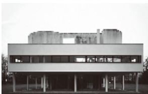
サヴォア邸 (フランス)