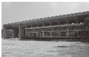
チャンディガール (インド)