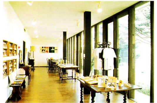
ミュージアムショップ“Le Vent”