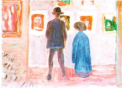
展示会の与謝野夫妻

1920年（大正9年）西村伊作は理想的な学校を創る夢を持って信州軽井沢で歌人と謝野寛、晶子夫妻、石井柏亭、赤城泰舒、河崎なつ達と話し合い翌年、東京駿河台に自由と芸術の教育を求め文化学院を開校しました。創立以来文化学院の教育に携わった一流の芸術家、識者たちの絵画、書、写真などが展示されています。