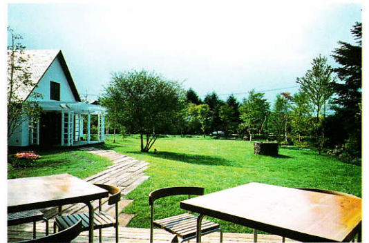
コーヒーショップ“Rolling Pin”