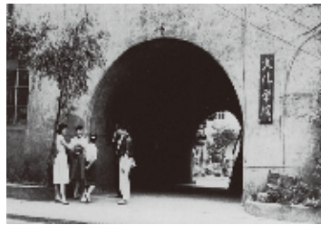
文化学院アーチの門