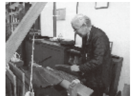
志村ふくみ 工房にて2015年