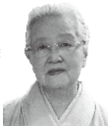
志村ふくみ Shimura Fukumi (1924-) 染織家・随筆家

大阪生まれ。1926年昭和学園に入学し特殊な環境で教育を受ける。幼い頃から絵を描くことが好きで、18歳の時陶芸家・富本憲吉に相談し、京都市の工業学校陶芸科に進む。画家を志して上京し、1940年に文化学院に入学。戦争の影が忍び寄る東京でニコライ堂や東京の風景など独自の手法で制作。1944年、病に伏しながらも仏画を描き続けるが、1947年、28歳でこの世を去る。