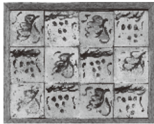
富本憲吉《葡萄模様タイル》1917年