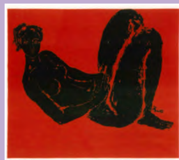
荻 太郎 裸婦