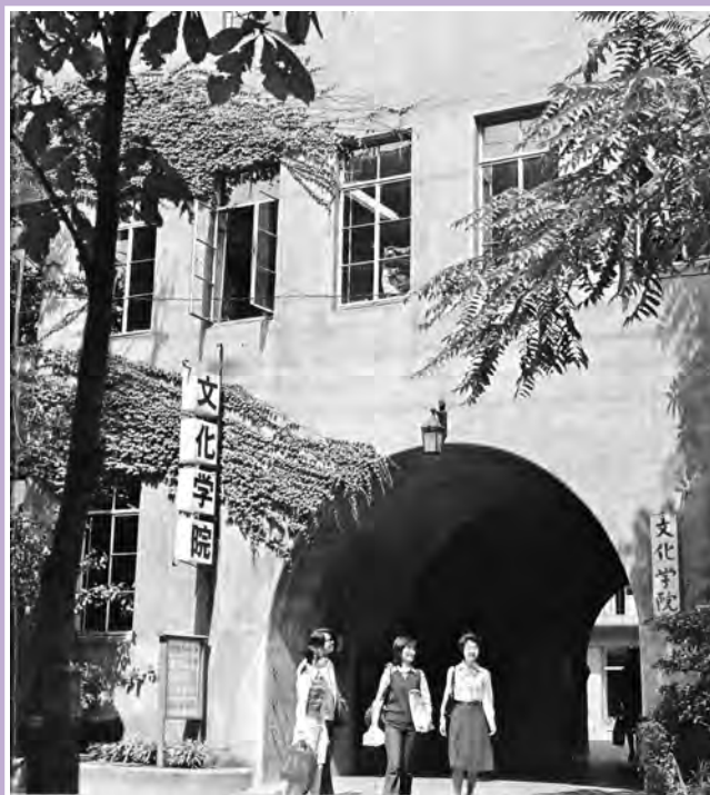
文化学院アーチ 1970年代