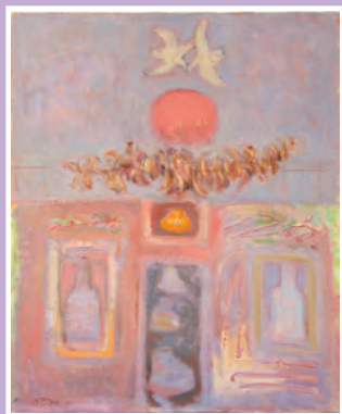
脇田 和 メキシコの太陽