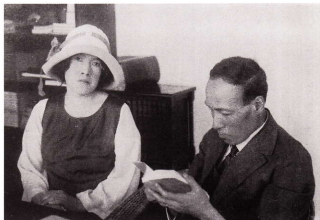
1926年 文化学院教室の与謝野夫妻