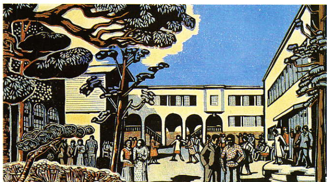
1930年頃 文化学院風景(木版)赤城泰舒画

1920年輕井沢に西村伊作、与謝野寛・晶子夫妻、石井柏亭、河崎なつが集まった。歓談の中で伊作が我が子を本当に行かせたい学校がないという話になり、「それでは子供達のために私達で学校を作りましょう」と云う事になって、文化学院の設立が決まった。本当に優しくて良い学校、ほかの学校のように規則や点数でしぼるのでなく、豊かな感性を持った人間に！伊作や晶子たちの情熱が今回の展示でいろいろと見えてきます。その知られざる事柄が当時の学生達の言葉からも伝わってきます。