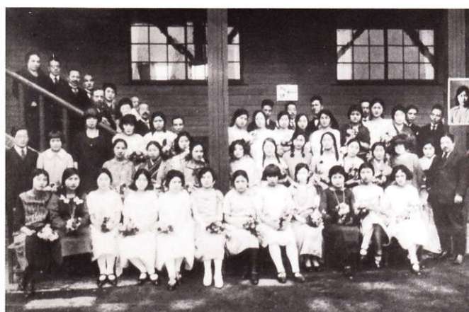
1925年 中学部第1回生の卒業記念写真