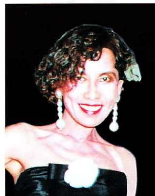
安井かずみ(作詞家)