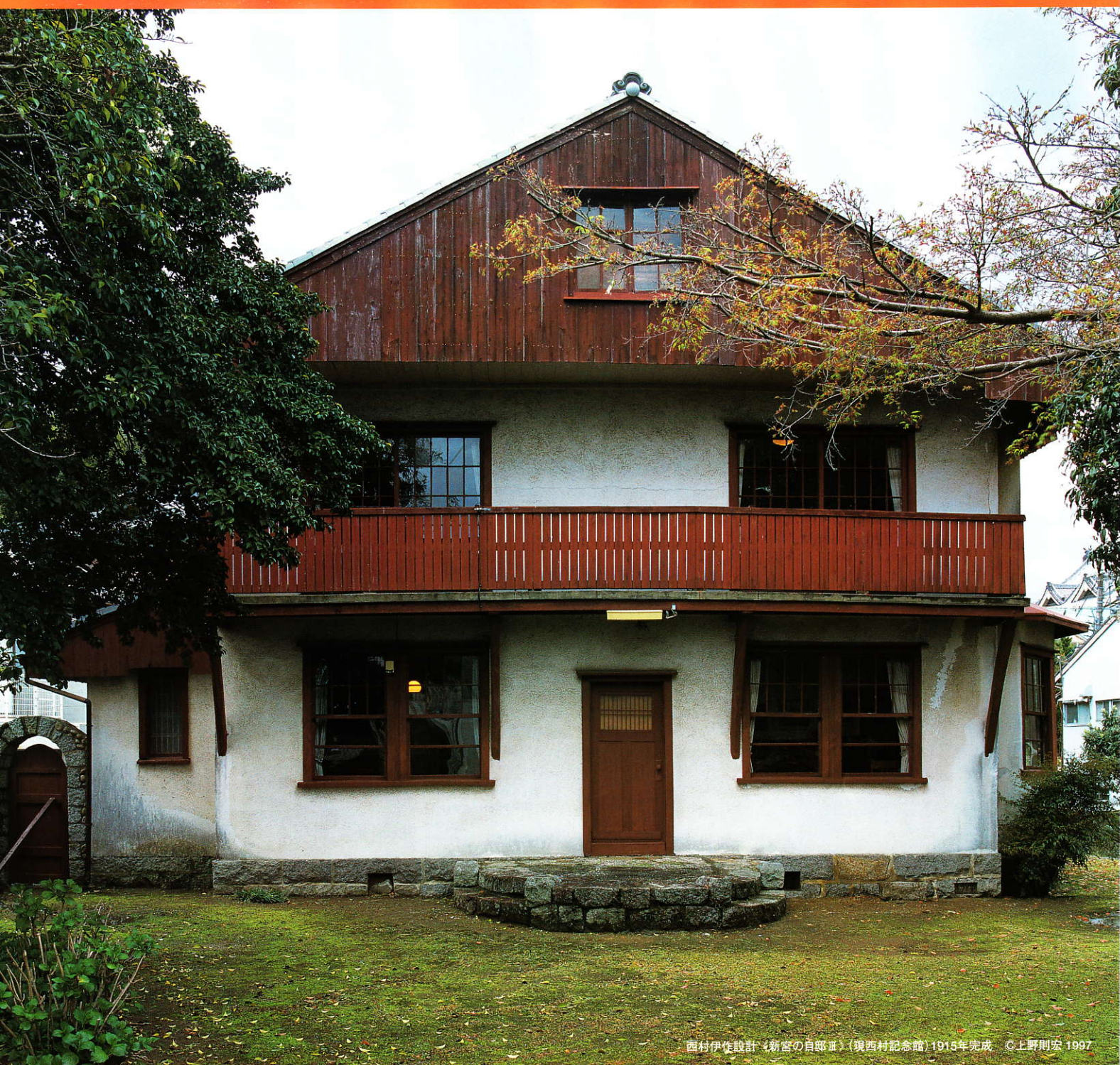
西村伊作設計「新宮の自邸Ⅱ」(現西村記念館) 1915年完成