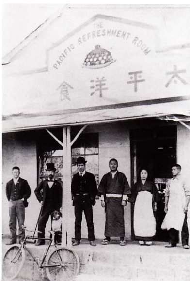
生活改善をめざして開店した太平洋食堂

家庭生活を大切にしたい伊作は、教育にも熱心に取組み、やがて1921年（大正10）私費を投じて東京神田駿河台に現在も自由な教育で知られる「文化学院」を設立し、生徒一人一人の個性を尊重し、自由に育む教育を実践しました。その自由さは戦前二度にわたり公権力の弾圧を受けますが、自らの理想を貫き通した生き方は、大正期を代表するモダニストとして、現在もなお多くの人々に感銘を与えています。