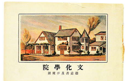
文化学院創立時の規則書 1921年

入館料：一般 800円 大・高 600円 中・小 400円 開館期間：4月27日(日)～11月3日(月) 土・日・祝のみ開館 10:00～17:00(夏期～18:00) (入館は閉館の30分前まで)