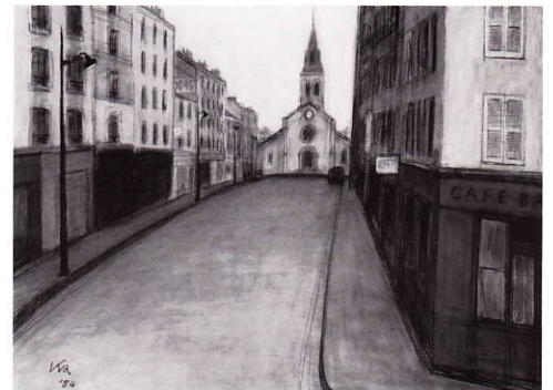
1984年 教会の見える風景