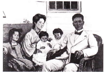
1913年 N氏の一家 石井柏亭

入館料 : 一般800円 大・高600円 中・小400円 団体割引、身障者割引有り