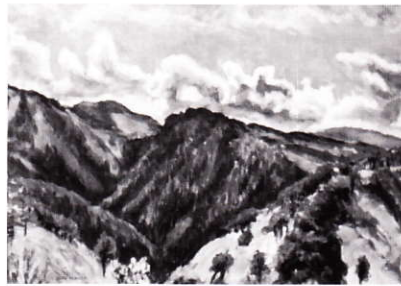
1916年 北山の山と雲 西村伊作