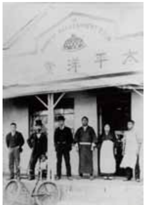
生活改善を目指して開店した太平洋食堂