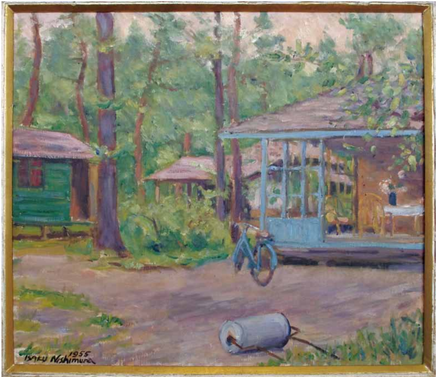
「軽井沢別荘」1955 油彩 西村伊作