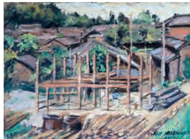
自邸Ⅲの新築現場 1914 (大正 3)