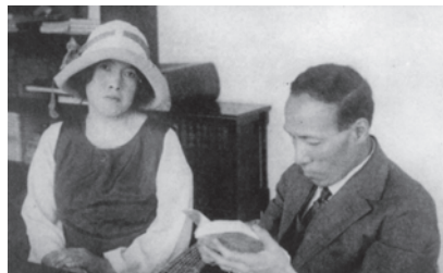
与謝野 寛・晶子 夫妻 1926 (大正 15)