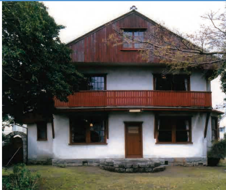
自邸Ⅲ 1914 (大正 3)