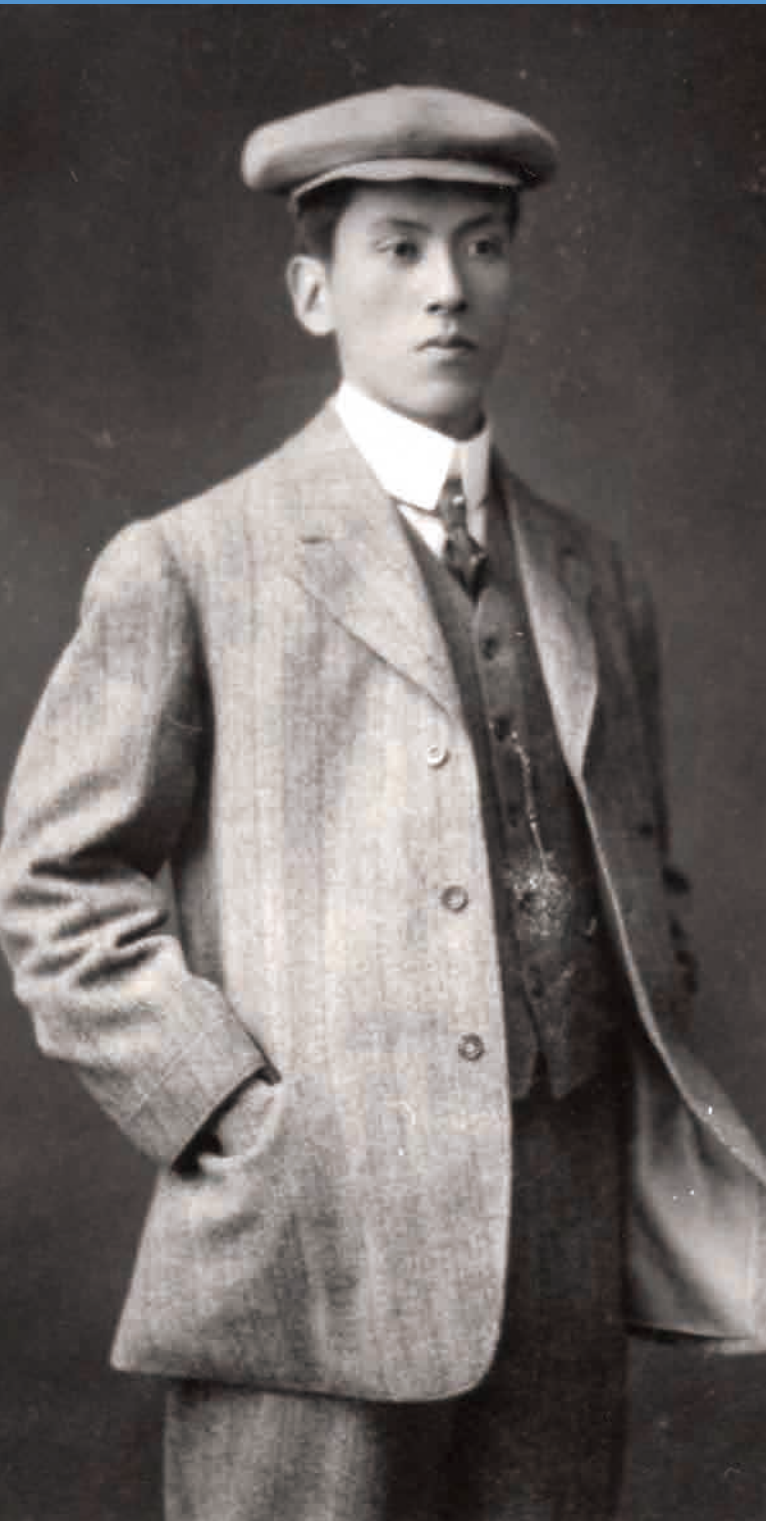
西村伊作 1908 (明治 41)