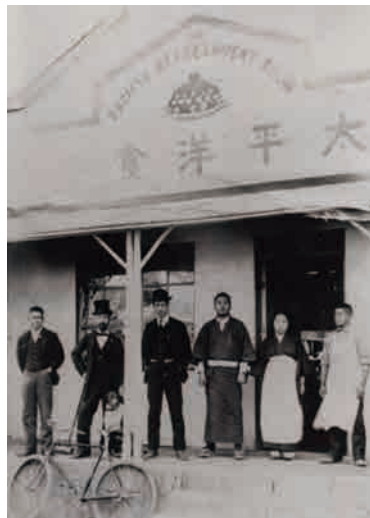
太平洋食堂 1904 (明治 37)