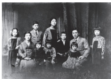
伊作の家族 1925 (大正 14)