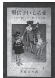
西村光惠著 1922 (大正 11)