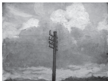
雲柱と雲 1914 (大正 3) 西村伊作