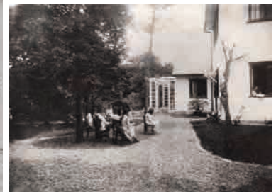
創立当時の文化学院 1921 (大正 10)