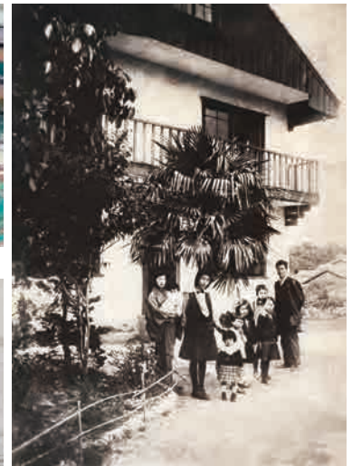
自邸Ⅲ前の伊作一家 1920 (大正 9)