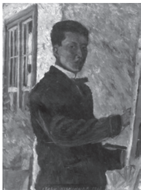
自画像 1913 (大正 3)