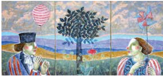
「微風」三連画 2016 吉屋 敬