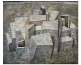
「フォルム '92-1」 斎藤康介