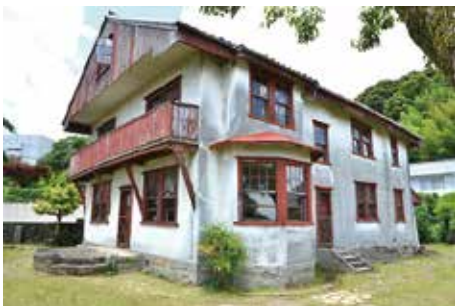
修復前の西村伊作自邸Ⅲ