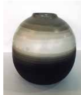
「炭火煉上湖音図壺」 小野寺 玄