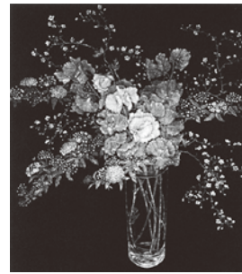
「春の花」 丹阿弥丹波子