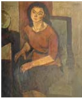
「Portrait of Nana No.4」 石丸 寛