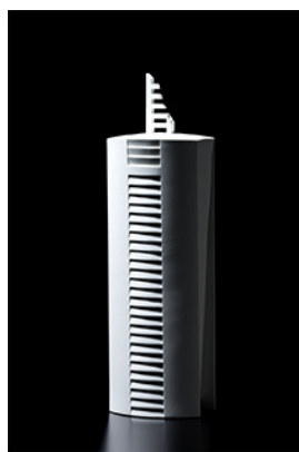
「白器 宇宙への階段」 和田の