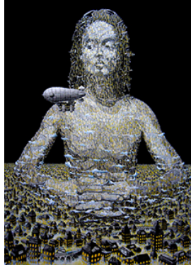
「自画像としての街」 柿沼 宏樹