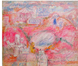
「風が運んで来たものたち」 上野 秀一