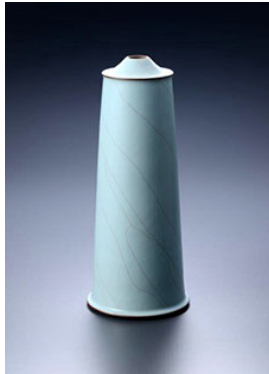
「青瓷壺」 志賀 暁吉