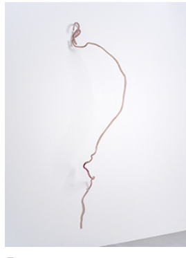
「Red Plant(1)」川内 理香子