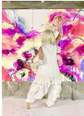
ライブペイント げるたま