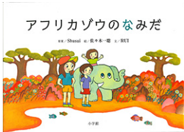
「アフリカゾウのなみだ」 小杉周水 佐々木一聡 RUI