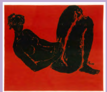
荻 太郎 裸婦