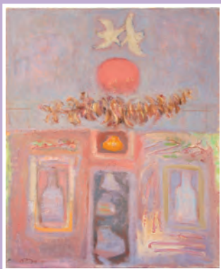
脇田 和 メキシコの太陽