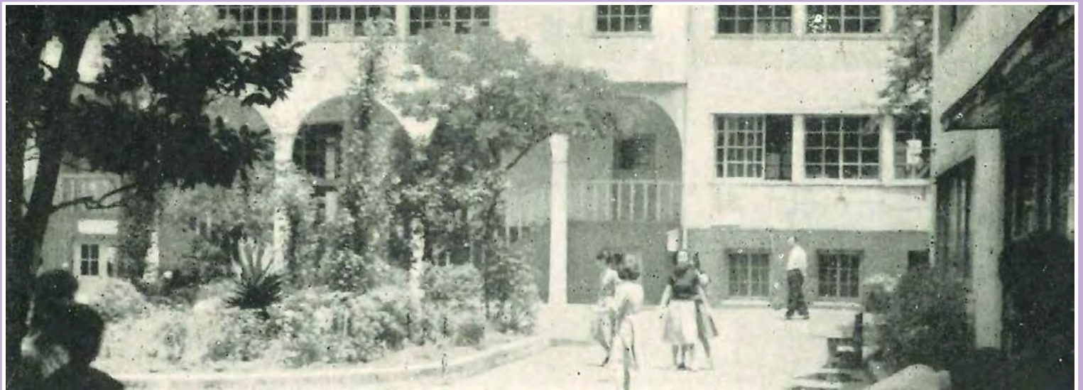
文化学院中庭 1950年代

Post War Revival and the Succession of Liberal Education