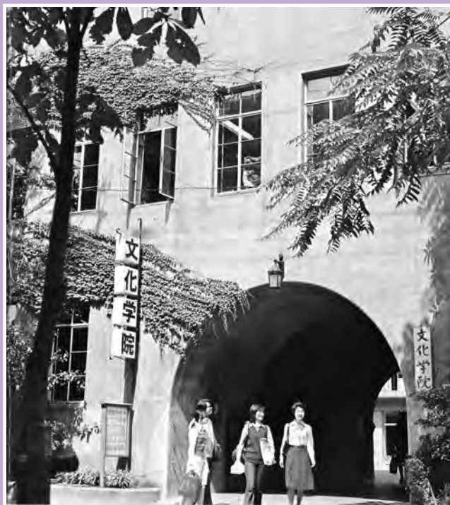
文化学院アーチ 1970年代