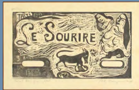
LE SOURIRE (微笑) ポール・ゴーガン