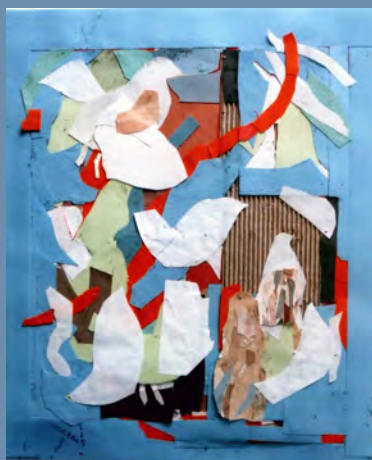
パピエコレ papier collé 紙片や木片などを台紙に貼り合せたコラージュ