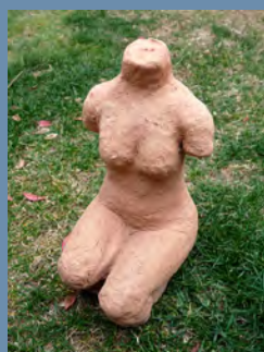
テラコッタ terra cotta 粘土を素焼きで仕上げる彫刻