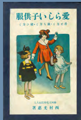
「愛らしい子供服」西村光恵著 1922

西村 光恵 1885年-1970年 新宮の裕福な材木問屋の娘として誕生。幼いころにみなしごになり家も倒産し、材木店を営む叔母一家に身を寄せ、家事と商売を手伝いながら大きな家を切り回す工夫を学ぶ。24歳、同郷出身で同じく幼くして両親を亡くした西村伊作と結婚。賢くセンスも優れていた光恵は、夫指導の下、洋裁、西洋料理、織物などを学び、西洋の生活スタイルで家庭を築く。まだ洋装が珍しい時代に9人の子供たちの洋服は光恵がすべて手作りし、子供服の本も出版。しかし光恵自身は生涯着物姿で通し、茶道、日本画、陶芸などを嗜み、独自のスタイルを貫く。自由人の西村伊作が理想の家庭づくりと人間教育を行った舞台裏に存在した妻光恵にスポットを当てます。