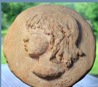
メダイヨン medaillon 円盤の浮彫